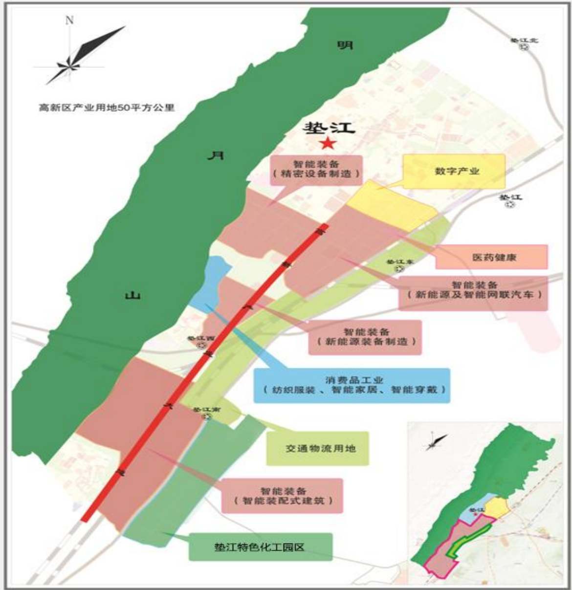
图1 垫江“十四五”制造业空间布局