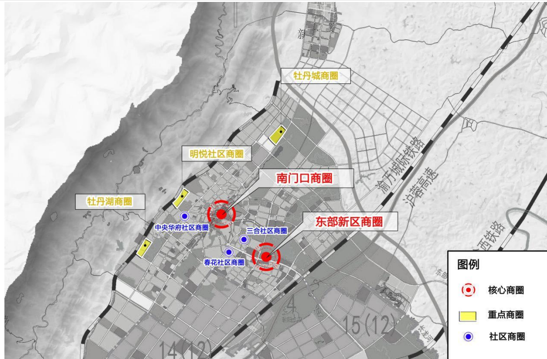
图 4-1 双核三片多点商圈体系图

市场为智慧化菜市场，新建南部菜市场、东部新区菜市场、狮子坡农贸市场，搬迁重建桂东菜市场，改造提升北门菜市场，推动全县必备型业态配置全覆盖，合理配置选择性业态，实现“居民出门步行5分钟到达便利店，10分钟到达超市、餐饮店，驱车15分钟可到达购物中心”目标。